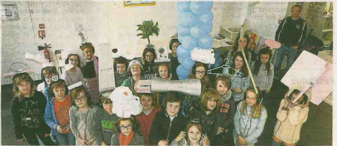
Aux Moyens du bord, les élèves du Poan-Ben découvrent l'univers du groupe Salut c'est cool. Ils les intervieweront le 14 mai.

« Regardez, j'ai un nuage en chewing-gum sur la tête ! » Lundi après-midi, dans les locaux de l'association Les Moyens du bord, à la manufacture, les élèves de CE2, CM1 et CM2 de l'école du Poan-Ben s'amuse autour d'objets d'art tous aussi farfelus que créatifs. C'est pour le projet « Le cri de la carotte le soir au coin du jardin » que les enfants découvrent l'exposition de « Salut, c'est cool », un groupe de musique électronique au style loufoque, innovateur et déjanté. Voilà plusieurs semaines que