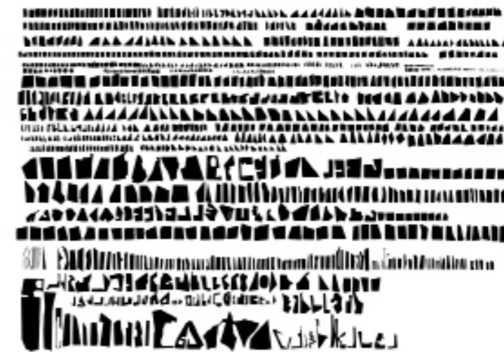
Berlin rmngé, Amélie Caron@Laurent Grivet - Lendroit éditions